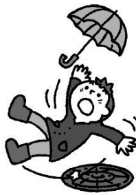
ケガや事故を防ごう