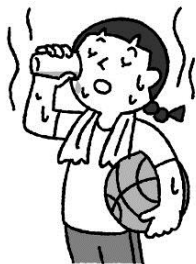
熱中症に気をつけて