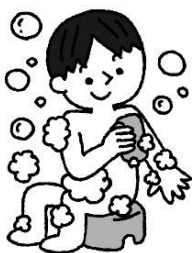
カラダや衣服を清潔に