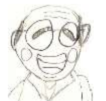
4年 浅いぶきさん画

子どもたちの懸命な姿を、気持ちよく応援していただければと願っています。ご理解・ご協力のほどよろしくお願いいたします。