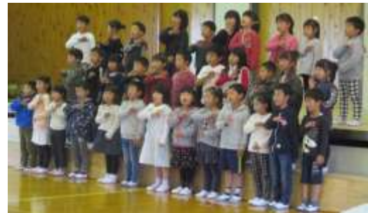
↑1年生の素敵な手話歌！