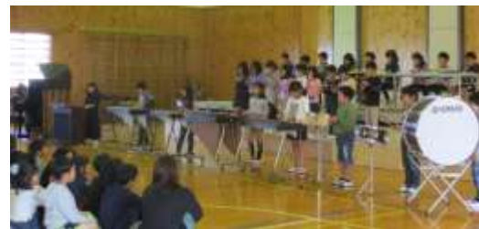
↑3年生の見事な合奏！