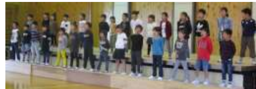
↑迫力満点！2年生の群読「おまつり」！