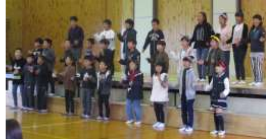
↑トップバッターは4年生！