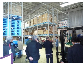
たくさんの物資が貯蔵されていました。これらの物資は、災害時には市の災害対策本部が管理・配付することになっています。