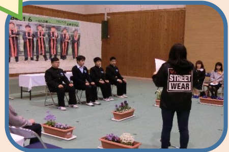
お世話になった先生からのメッセージ