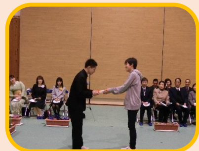
生徒会から感謝をこめて…