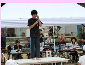
生徒会長のあいさつ

中学生も地域の人に交じりながら、前日までの準備や当日の運営などに取り組んでいます。自分たちの仕事や役割を果たすことによって責任感が育ち、また小学生を指導したり、保育園児に目を配るなど、個々に「将来の地域の担い手」としての自覚も生まれてきています。地区の方々にも子どもたちの成長を感じていただく、大きなイベントとなっています。