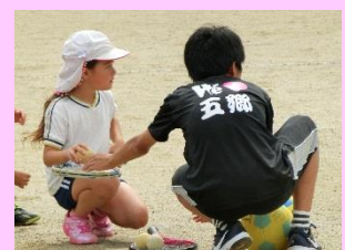
小学生を気遣う姿も・・・